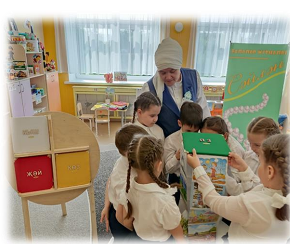
Проведение ООД по темам «Туган ягым – яшел бишек», «Туган эҗирем»