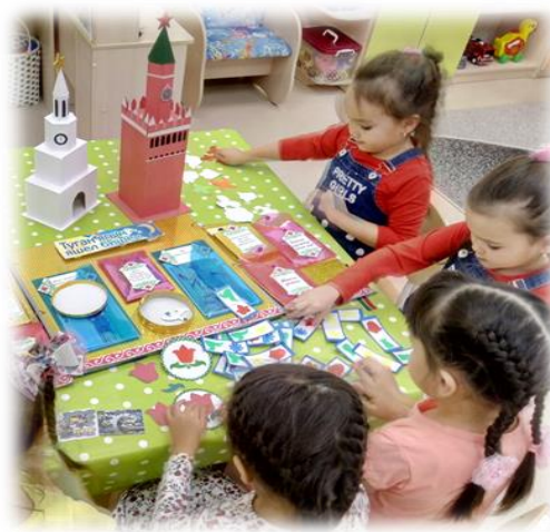
Тематические беседы «Мы разные - но мы вместе!», «Народные традиции», «Многонациональный Татарстан», «Бытовая культура народов родного края»